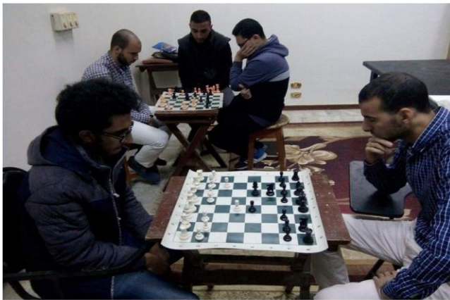
دورى الشطرنج بالكلية