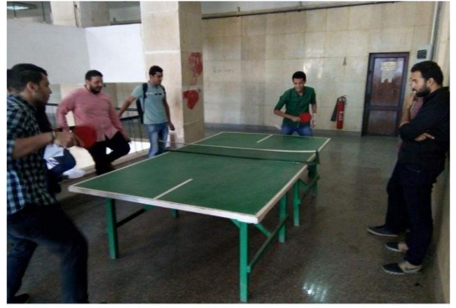
دورى البنج بالكلية