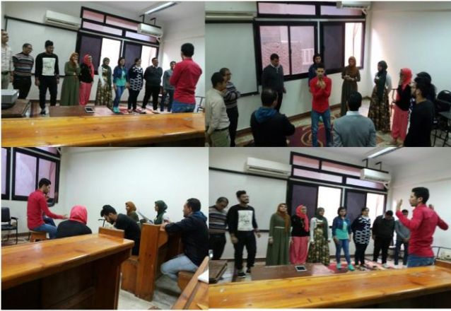
تدريب مسرح - ١٣ / ١١ / ٢٠١٧

١-١٢. تم تقسيم الطلاب وعمل الإعلانات المناسبة.