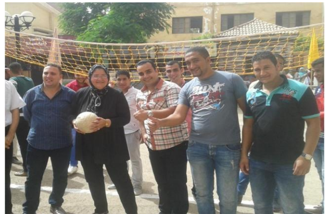
اليوم الرياضى الأول بكلية الصيدلة